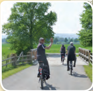
Radtour an der Leine