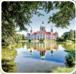
Neues Rathaus Hannover