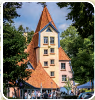
Theater der Nacht Northeim