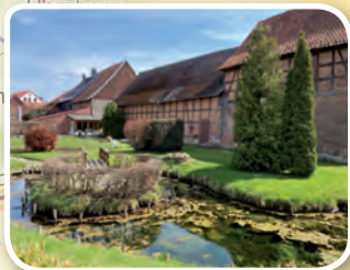
Leinequelle in Leinefelde