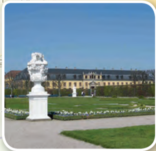
Großer Garten Herrenhausen